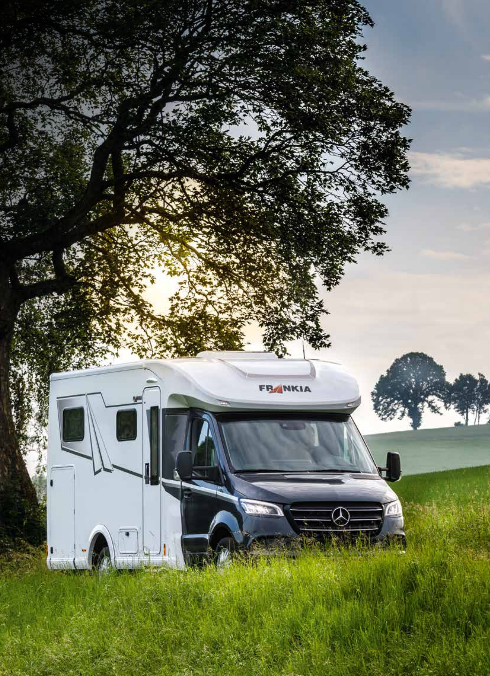
2 FRANKIA MT 7 GDK NEO (afbeelding als voorbeeld)