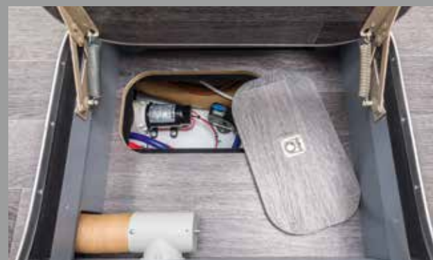
Belangrijke zaken bereikbaar vanuit het interieur