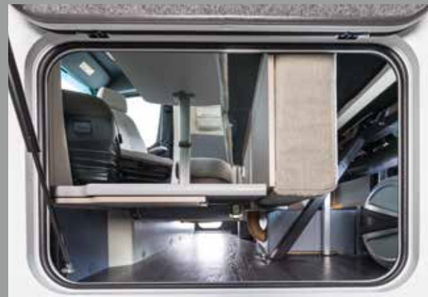
Meer dan genoeg ruimte in de FRANKIA dubbele bodem

Slimme nieuwe klepoplossing: opbergruimte in de zitgroep