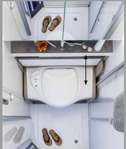
Toiletzitting verdwijnt via push-to-open onder de wastafel